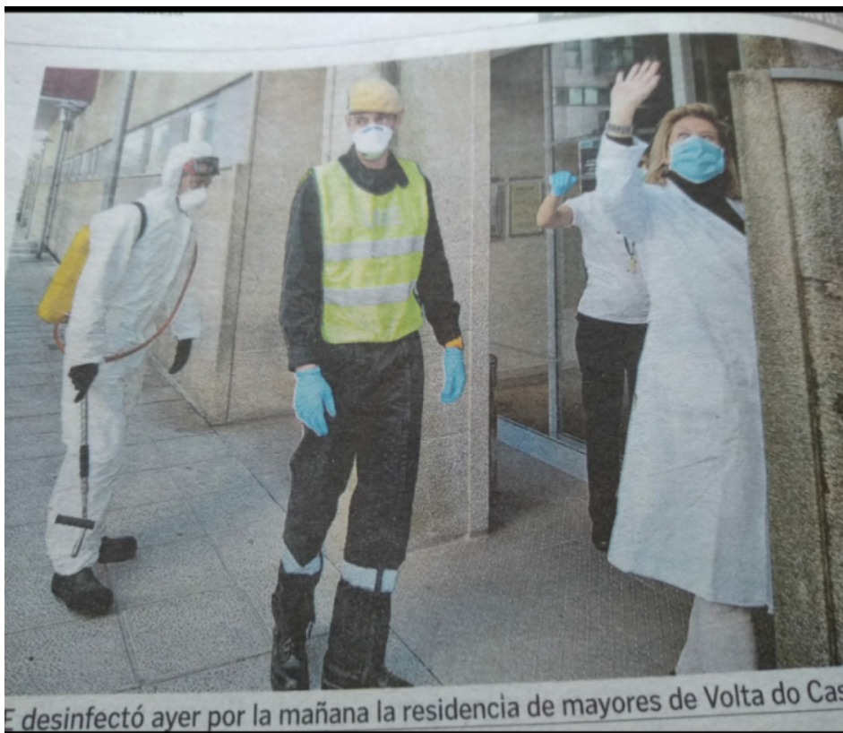
Figura 1: Foto de La Voz de Galicia de 27/03/2020

O día 26 de marzo a UME acude á Residencia de Maiores de Volta do Castro a desinfectar e a directora que ata ese día non quería que o persoal usara máscaras sale á porta principal do centro a saudar aos veciños que aplaudían o traballo de desinfección da UME, con máscara cirúrxica correctamente colocada e bata, e sin luvas polo que se pode observar na foto publicada na prensa que se remite.