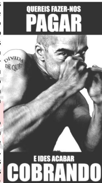
Novas da Galiza