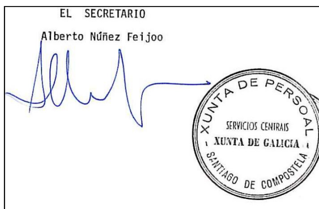
Acta núm. 1 da Xunta de Persoal SSCC (28-01-1988)