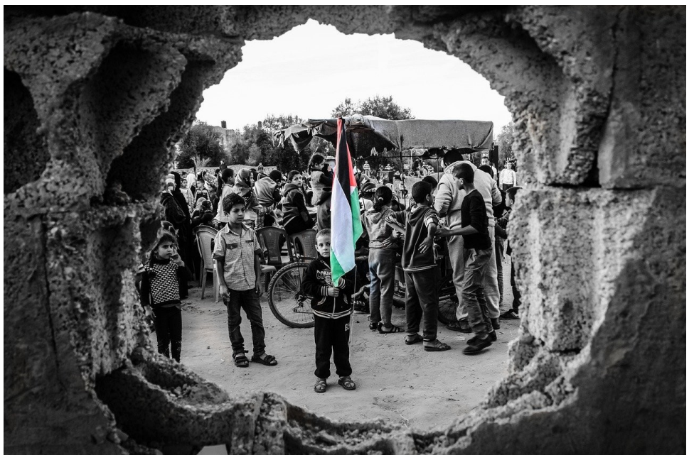
Non ao xenocidio de Palestina

Na CIG, solicitamos á Xunta de Galiza unha rectificación e realizaremos un seguimento exhaustivo e polo miúdo do que vai pasar no futuro ao respecto destas prazas, estando totalmente en contra da manipulación e politización da Función Pública.