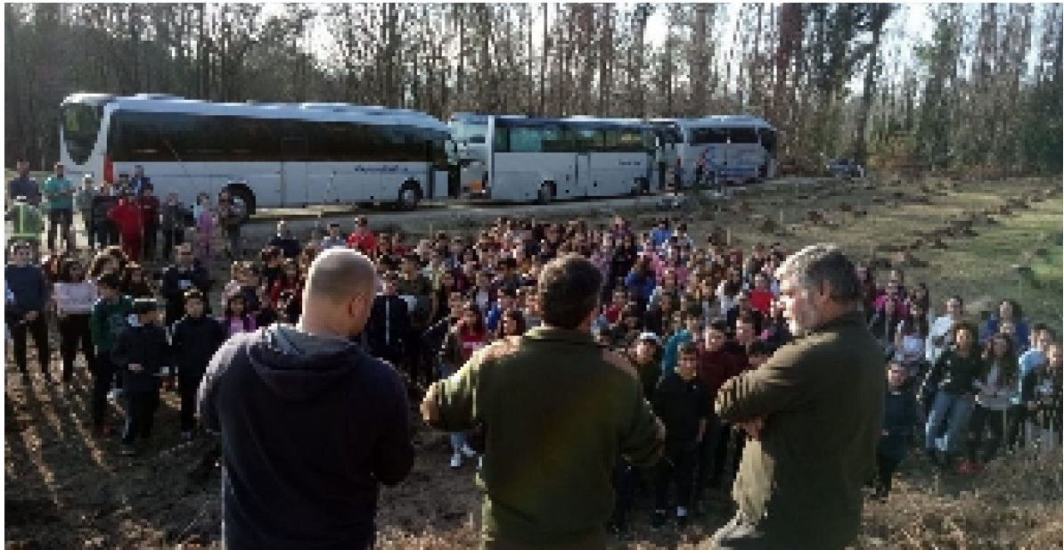
Imaxe 7.6.1. Plantación de carballos no marco do programa O monte vivo, en Salvaterra do Miño

O obxectivo do antedito programa é fomentar a participación activa e responsable dos escolares na protección do medio natural fronte aos incendios forestais, permitindo que tomen conciencia dos valores dos bosques, o seu uso sostible, a contribución á protección da biodiversidade e a influencia dos lumes forestais na diminución da biodiversidade ou a perda de capacidade produtiva do monte.