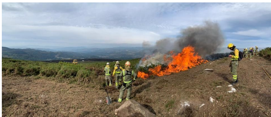
Imaxe 2.3. Manobras con lume real aplicando e adestrando o modelo organizativo do SEMOP