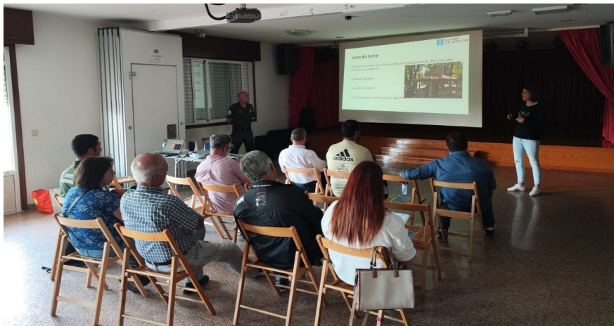
Imaxe 2.5. Formación a poboación do rural en Budiño (O Porriño)