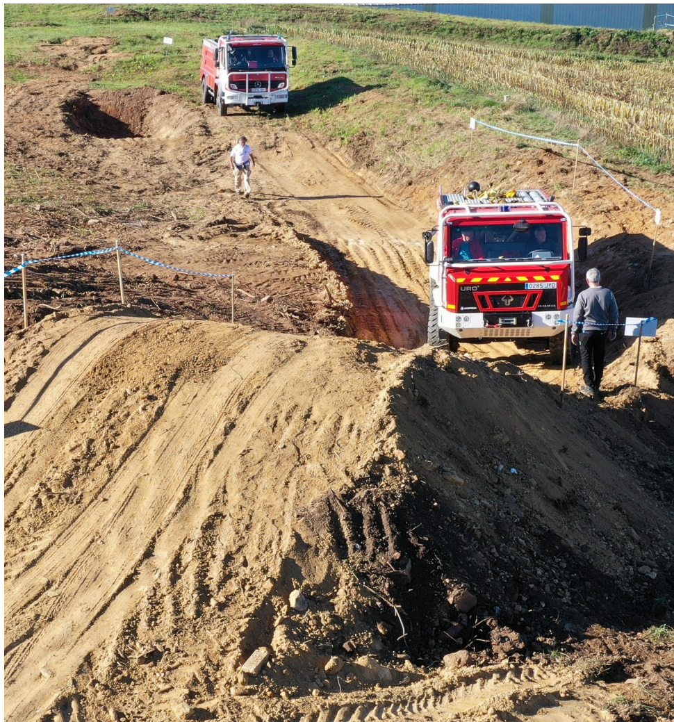
Imaxe 2.1. Curso de seguridade no manexo dos vehículos todoterreo