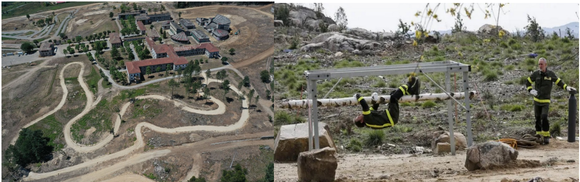
Imaxe 5.3. Circuitos de bombeiros/as forestais e de condución 4x4 no CILL de Toén

interface urbano-forestal e condución de vehículos todoterreo.