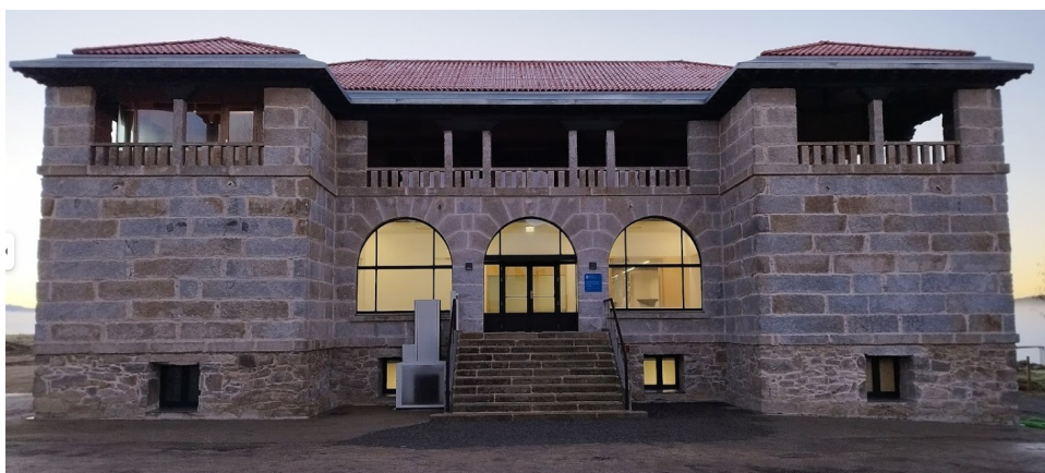
Imaxe 5.1. Edificio rehabilitado da antiga lavandería no CILL de Toén

As instalacións onde se imparte a formación son diversas, os adestramentos e simulacros adoitan ser no monte ou parcelas a ceo aberto dentro do ámbito do distrito ou provincia. En ocasións recorreuse a instalacións municipais para os módulos máis teóricos dos adestramentos, tamén se empregaron instalacións da EGAP para algunha charla. Pero a maior parte da formación teórico-práctica realizase nas instalacións da AGASP e, desde 2023, no Centro Integral de Loita Contra o Lume (CILL) de Toén, en Ourense.