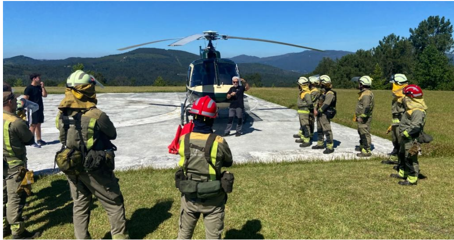
Imaxe 2.2. Formación

específica para brigadas helitransportadas